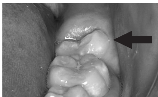
萌出中の第二大臼歯