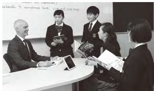
スーパーイングリッシュコース（中学校）