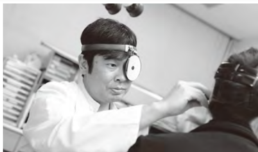
活躍する本校卒業生

News 2018年4月より医・歯学部進学希望者向け「医進・特進コース」スタート