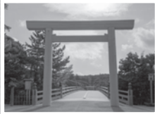
伊勢神宮