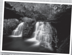
赤目四十八滝