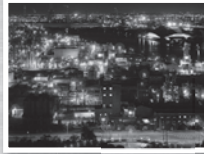
四日市工場夜景