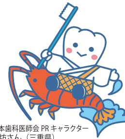
日本歯科医師会 PRキャラクター よ坊さん (三重県)

野球/ソフトボール/サッカー バスケットボール/ハンドボール バレーボール/バドミントン テニス/ウェイトリフティング 体操/フィールドホッケー レスリング/テコンドー/格闘技 スキー/スケート/スノーボード リュージュ/スケートボード モーターサイクル/自転車/競輪 ハングライダー/スカイダイビング 砲丸投げ/円盤投げ/槍投げ 水泳/水球/高飛び込みなど 競艇/乗馬/馬術/競馬