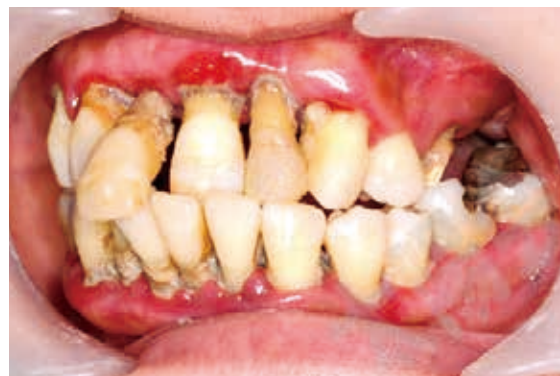
重度歯周病を併発している糖尿病患者の口腔内