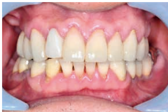
歯周病管理されている糖尿病患者の口腔内