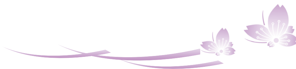
平成20年7月診療分歯科診療報酬状況（三重県）