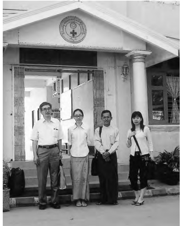
ワッチェ慈善病院前で 左から私、日本人Dr、 ジャパンハートのスタッフ、歯科衛生士

旅行の結果、ミャンマーの人々は貧しいけれど敬虔な仏教徒で、非常に心穏やかで、まさに昔の日本人を見るようであった。しばらく日本で働き、その後本国で口腔衛生活動に邁進していただくことは非常に有意義なことだと確信した。(現在、ミャンマーには歯科衛生士という職業はない。)日本語学校で、私のところの歯科衛生士が、歯科衛生士の職業について講演をしたところ反応は非常に良かった。歯科医療支援については、ワッチェ慈善病院(ジャパンハートの医師、看護師が悪い環境の中エネルギーに活躍している、坊さんが経営する病院)の歯科室に5台のユニット(4台は使用可能か?)が設置されており、土日にミャンマーの歯科医師と歯科技工士が治療しているが、絶対量の歯科医療が不足している状態であった。ジャパンハートの看護師は、周辺の地域学校などでも衛生活動で巡回しており、歯科衛生士の方が