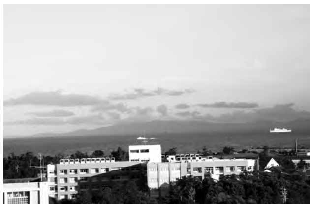
伊勢湾とセントレア向艇